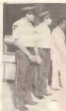
Diputado D. Leo ta accionnan pa bomberos na San Ni...